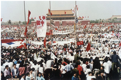
1989 මැයි මාසයේ චීනයේ ටියන්න්මෙන් වතුරග්‍රයේ මහජන විරෝධතාවක්

රාත්‍රියෙන් පසු දින හා සතිවල කුරිරු මිලිටරි මර්දනය කල කුටප්‍රාප්ති වීම චීනයේ තීරණාත්මක ඓතිහාසික සන්ධිස්ථානයක් වූ අතර, ජාත්‍යන්තරව සිදු වෙමින් පැවති ස්ටැලින්වාදයේ අර්බුදයේ ප්‍රධාන අංගයක් විය.