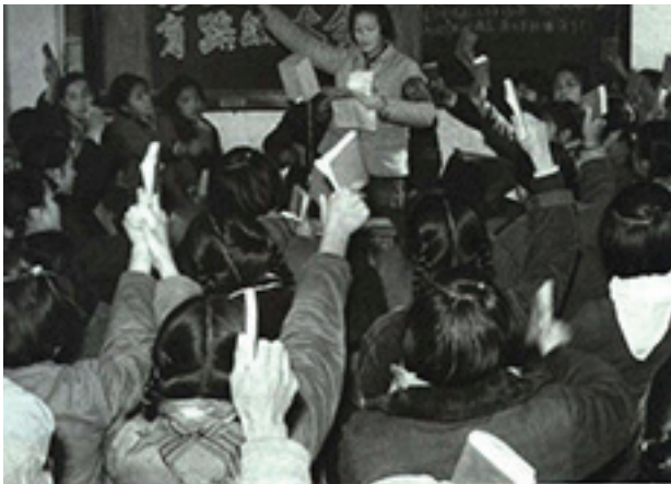
සංස්කෘතික විප්ලවය අවධියේ සිසුහු

මාඕ සහ ඔහුගේ කල්ලිය “ධනවාදී මාවත් සොයන්නන්” හෙලා දකිමින් සමාජවාදයට වන ඔවුන්ගේ ඇල්ම ප්‍රකාශ කල ද, ඔවුන්ට විකල්පයක් ඉදිරිපත් කල නො හැකි විය. ස්වයංපෝෂිත චිනයක් පිලිබඳ මාඕගේ මනාකල්පිතය ව්‍යාසනයක් බව ඔප්පු වී තිබුනි. රට පුරා පැතිරී පැවති දැවැන්ත ආර්ථික හා සමාජීය ගැටලු විසඳීමට අපොහොසත් ව, සෝවියට් සංගමය සමඟ මිලිටරි ගැටුමකට මුහුණ දුන් සීසීපී නිලධරය, එක්සත් ජනපද අධිරාජ්‍යවාදය සමඟ සෝවියට් විරෝධී සන්ධානයක් ඇති කර ගත් අතර එය චිනය ගෝලීය ධනවාදයට ඒකාබද්ධ වීමට පදනම දැමී ය. වෙලදපොල ප්‍රතිසංස්කරණ ආරම්භ කිරීමේ ගෞරවය ඩෙන් ෂියාඕපින්ට හිමිවන අතර, 1972 දී එක්සත් ජනපද ජනාධිපති රිචඩ් නික්සන් සමඟ මාඕගේ එකඟතාවය විදේශ ආයෝජන හා බටහිර රටවල් සමඟ වෙලදාම වැඩි කිරීම සඳහා අත්‍යවශ්‍ය දේශපාලන හා රාජ්‍ය තාන්ත්‍රික පූර්ව කොන්දේසිය විය.