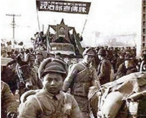
1949 චීන විප්ලවයේ දී ජනතා විමුක්ති හමුදාව බෙයිජිංහිදී ඇතුලුවෙයි

1949 චීන විප්ලවය, දියුණු ධනෝභව රටවල් තුළ මෙන් ම, දෙවන ලෝක යුද්ධය ඉක්බිතිවේ චීනය වැනි කල් පසු වූ ධනෝභව වර්ධනයක් සහිත රටවල් තුළ ද මතු වූ විප්ලවවාදී අරගල රැල්ලක කොටසක් විය. ප්‍රතිගාමී හා අර්බුදයෙන් ඔද්දල්ව පැවති කුවොමින්ටාං තන්ත්‍රය පෙරලා දැමීම, රට බෙදා තිබූ ද දරිද්‍රතාව හා පසුගාමීත්වයේ ගිල් වූ ද අධිරාජ්‍යවාදයට එරෙහි දැවැන්ත පහරක් විය. එය ප්‍රකාශ කළේ ආර්ථික ආරක්ෂාව, මූලික ප්‍රජාතන්ත්‍රවාදී හා සමාජ අයිතිවාසිකම් සහ දශක ගනනාවක දේශපාලන නැගීටීම් හා යුද්ධයෙන් පසු යහපත් ජීවන තත්වයක් සඳහා වූ ජනගහනයේ අති බහුතරයකගේ අභිලාෂයන් ය.