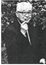
චීන ට්‍රොට්ස්කිවාදී පෙන්නුම් ෂුෂි

අවසානය හා ජපාන අධිරාජ්‍යවාදයේ පරාජයෙන් පසුව මාඕවාදී නායකත්වය, මොස්කව් තත්ත්වය විසින් ජාත්‍යන්තර ව ස්ථාපිතවාදී පක්ෂවලට නියම කල පිලිවෙත අනුගමනය කරමින් මුලින් උත්සාහ කලේ, අධිරාජ්‍යවාදය සමඟ යුද කාලීන සන්ධානය දිගට ම පවත්වා ගෙන ගෙන යාමට හා විශංකායි-ෂෙක් සමඟ සහාග රජයක් පිහිටුවීමට ය. එය කල්පසුව 1947 ඔක්තෝබර් මාසයේ දී පමනක්, කුවොමින්ටානය බලයෙන් පහ කිරීම ඉල්ලා සිටියේ ය. සීසීපීය කමිකරු පන්තිය බලමුලු ගැන්වීමට කිසිදු උත්සාහයක් නො ගත් අතර, එය නගරවලට ඇතුලු වෙමින්, "නව ප්‍රජාතන්ත්‍රවාදයක්" පිලිබඳ මාඕගේ ඉදිරිදර්ශනය සහ සුලු ධනෝශ්වරය හා ජාතික ධනෝශ්වරයේ සන්ධානයක කොටසක් ලෙස පුද්ගලික දේපල ආරක්ෂා කිරීමට පියවර ගත්තේ ය.